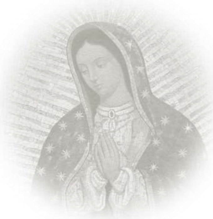
Imagen: Un mosaico de Nuestra Señora de Guadalupe decora un altar lateral de la Iglesia Santa Maria Regina della Famiglia en Ciudad del Vaticano, 15 de diciembre.