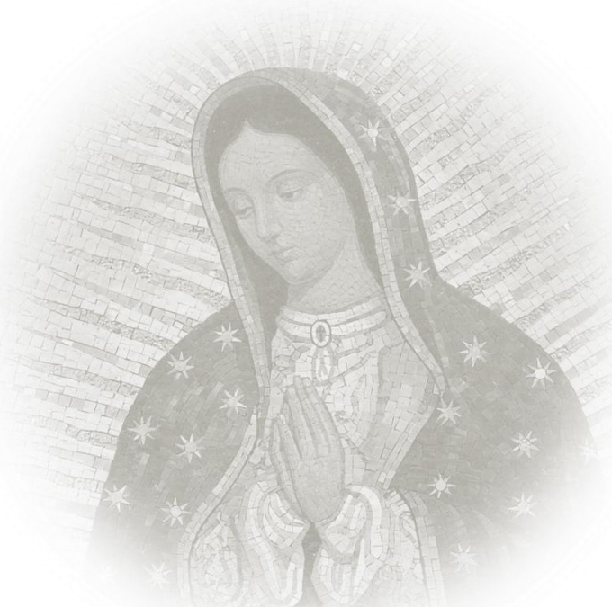
Imagen: Un mosaico de Nuestra Señora de Guadalupe decora un altar lateral de la Iglesia Santa Maria Regina della Famiglia en Ciudad del Vaticano, 15 de diciembre.