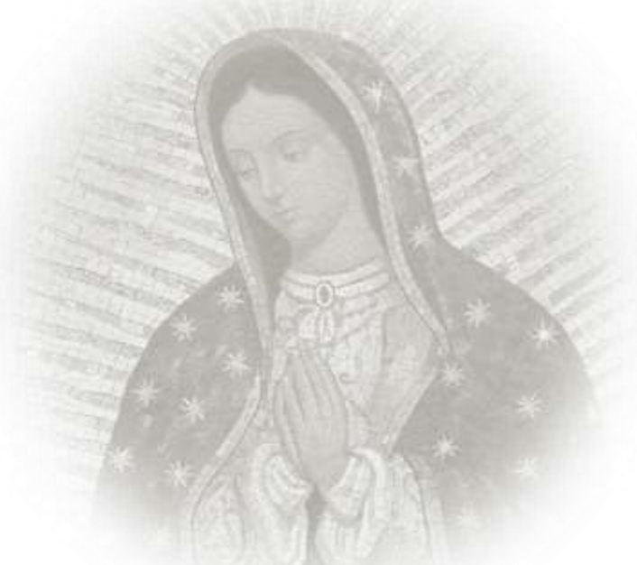
Imagen: Un mosaico de Nuestra Señora de Guadalupe decora un altar lateral de la Iglesia Santa Maria Regina della Famiglia en Ciudad del Vaticano, 15 de diciembre.