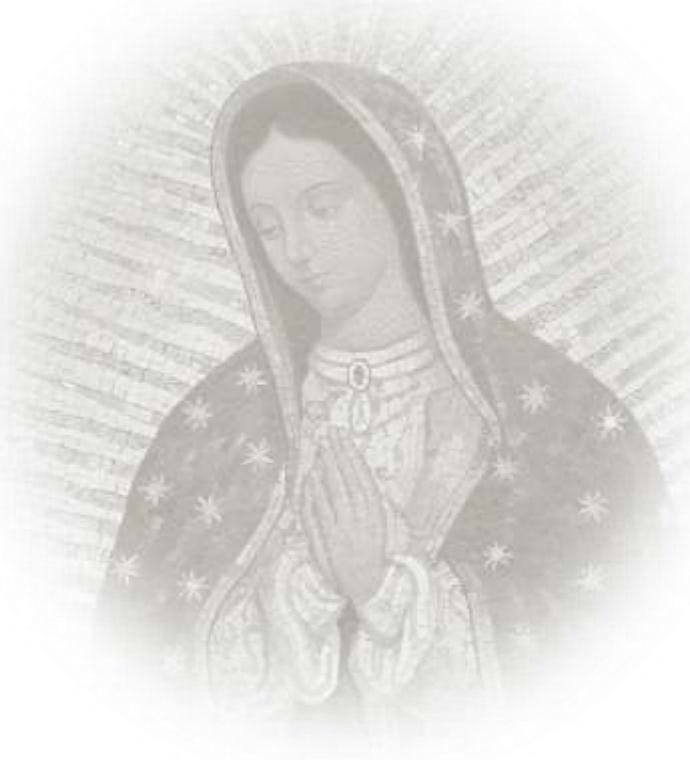
Imagen: Un mosaico de Nuestra Señora de Guadalupe decora un altar lateral de la Iglesia Santa Maria Regina della Famiglia en Ciudad del Vaticano, 15 de diciembre.