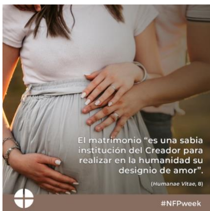
Gráfico: inglés | español

¡Vean, bajen y soliciten los materiales del Programa Respetemos la Vida 2020-2021 www.respectlife.org